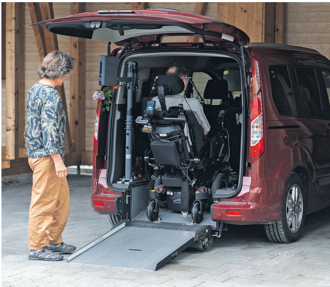
Dank des Elektrorollstuhls kann sich André Brefin selbstständig fortbewegen, und auch das rollstuhlgängige Auto ermöglicht Mobilität.