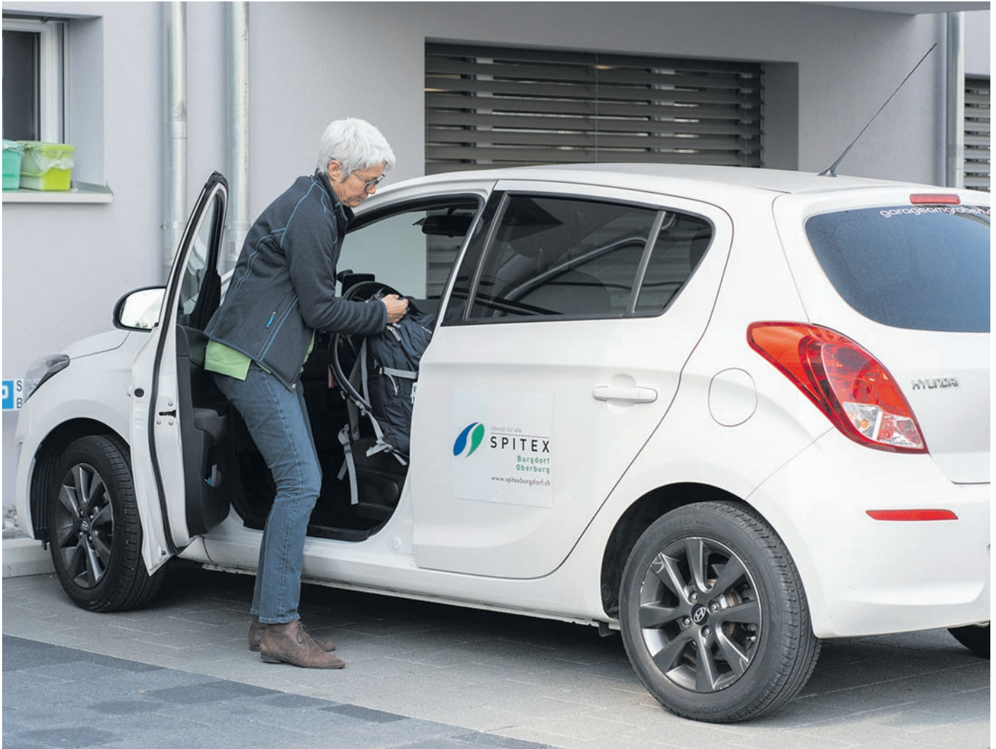
Durch den MPD können auch Menschen mit komplexen Krankheitsverläufen zu Hause sterben.

bens vorbereiten: «Meine Erfahrung und die klare Kommunikation bringen viel Sicherheit und Entlastung.» Als MPD-Mitarbeiterin steht sie für alle beratend zur Seite und deckt zusammen mit ihrem Team auch den 24-Stunden-Pikettdienst ab: «In Notfallsituationen am Wochenende, an Feiertagen oder in der Nacht können wir so Hospitalisierungen oft verhindern und sorgen dafür, dass die Betroffenen zu Hause bleiben können.»