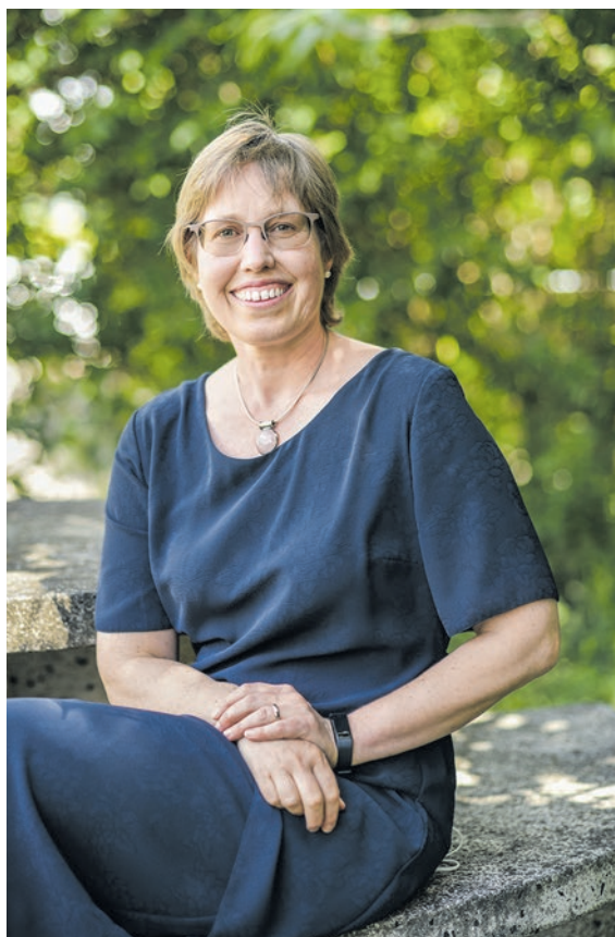
«Es ist unsere Pflicht, gut zusammenzuarbeiten.»

Ich könnte Ihnen ganz viele Geschichten erzählen! Ein aktuelles Beispiel, welches mir besonders unter die Haut ging: Ein knapp 70-jähriger Mann mit komplexer Krankengeschichte brauchte dringend einen Platz auf der geriatrischen Akutabteilung eines Spitals. Da seine Krankenkasse diese Kosten nicht übernehmen wollte, konnte er nicht hospitalisiert werden. Es dauerte lange, bis ich trotz meiner guten Kontakte einen Platz in einem für ihn geeigneten Spital fand. Nun, da er wieder daheim ist, geht die Spitex regelmässig bei ihm vorbei. So können wir hoffentlich verhindern, dass der Mann bald wieder hospitalisiert werden muss.