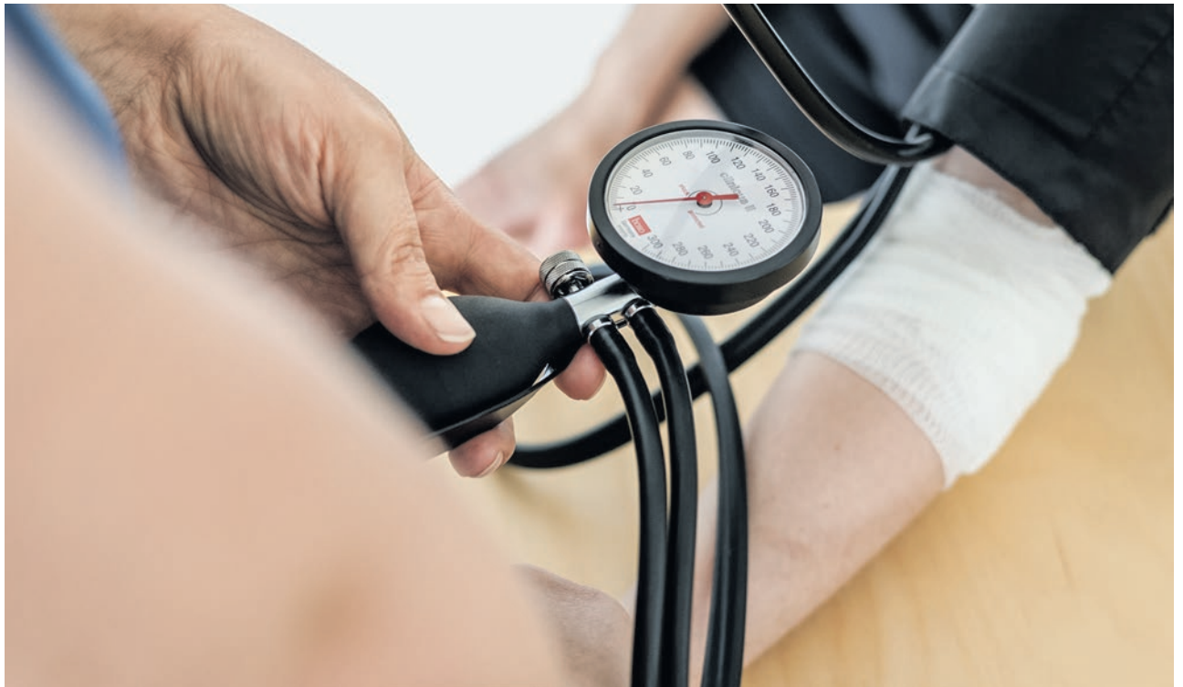
Nach dem Spitalaustritt überprüft die Spitex einmal pro Tag zu Hause die Vitalparameter.